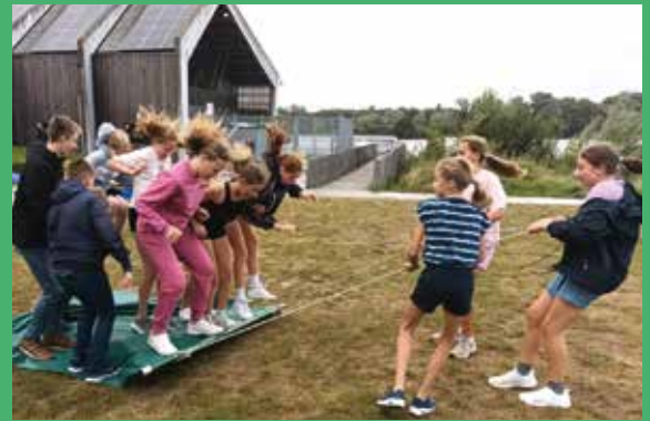
Plezier en ontspanning buiten het internaat

Op het internaat voelt het voor mij echt als een tweede thuis. Het is hier superleuk en je leert er ook zelfstandig zijn, maar je staat er nooit alleen voor. Er worden regelmatig toffe activiteiten op woensdagmiddag en 's avonds georganiseerd. Denk aan sport en spel, of gezellig samen bakken! Op internaat is het eigenlijk nooit saai, want er is altijd wel iemand om mee te lachen. Het voelt een beetje als een grote familie waar iedereen welkom is.